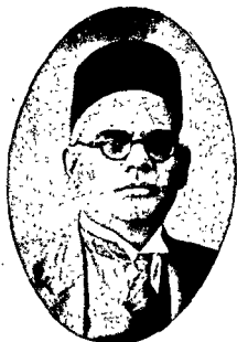
डा. सर गोकुलचन्द नारंग, लाहौर